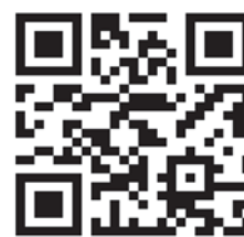
zur Seite der LpB